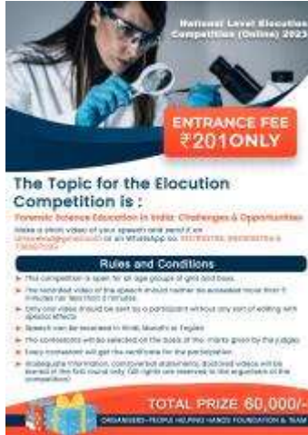
WhatsApp Image 2023-09-26 at 10.32.53.jpeg ~390 KB

सोबत - राष्ट्रस्तरीय ऑनलाईन वक्तृत्व स्पर्धा २०२३ मराठी व इंग्रजी भाषेतील माहिती पत्रक व सहसंचालक, तंत्र शिक्षण पुणे विभागाचे परिपत्रक.